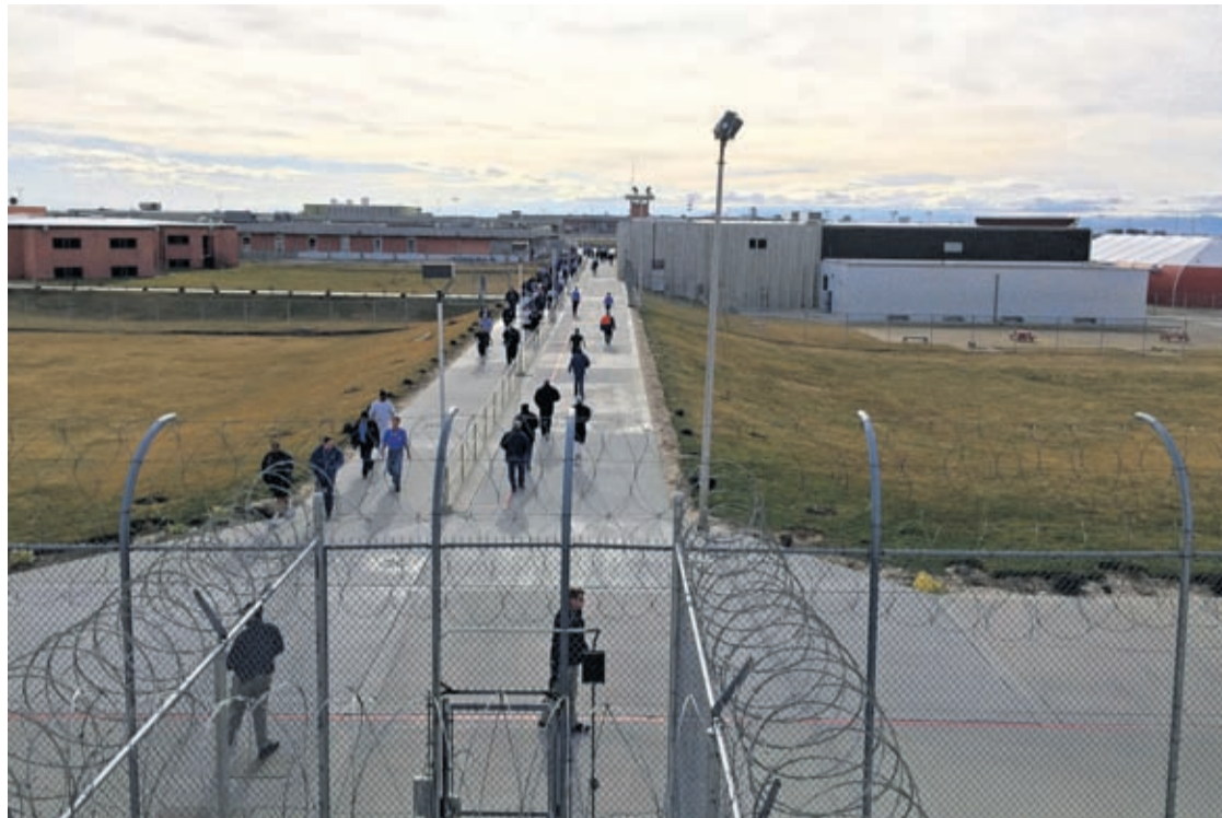
In this Jan. 30, 2018, file photo, inmates walk across the grounds of the Idaho State Correctional Institution in Kuna, Idaho.

The IRS doesn't yet have numbers on how many payments went to prisoners, Smith said. But initial data from some states suggest the numbers are huge: The Kansas Department of Correction alone intercepted more than $200,000 in checks by early June. Idaho and Montana combined had seized over $90,000. Washington state, meanwhile, had only intercepted about $23,000 by early June. Some states, like Nevada, have refused to release the numbers,